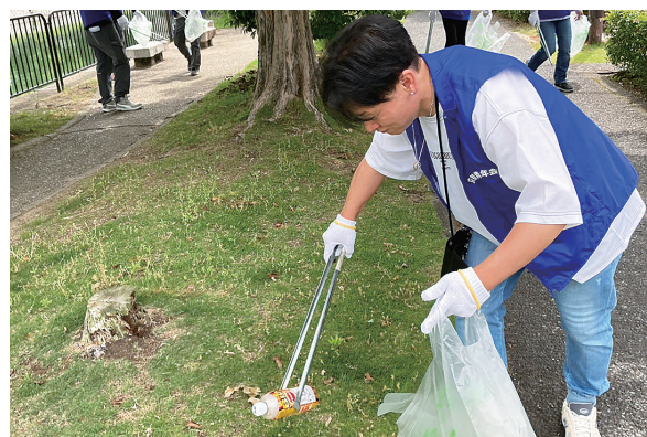
水道週間に伴う清掃活動