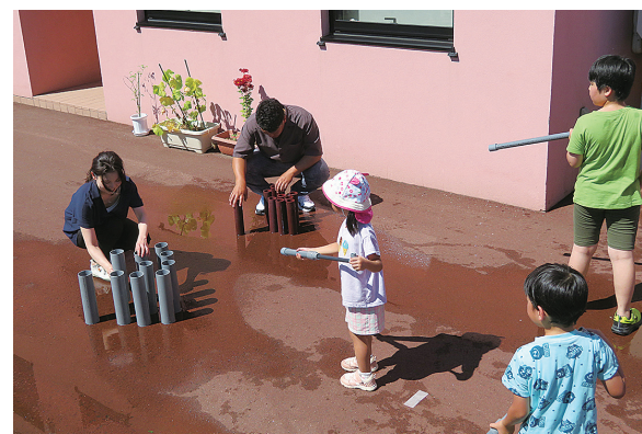
塩ビ管水鉄砲制作体験～水鉄砲で遊ぶ子どもたち