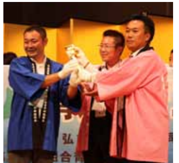
黄金のパイレンで青森へバトンタッチ

青年部の県連組織がない埼玉で、オール埼玉にて皆様をお迎えさせて頂きました。交流のなかった単組が、総会というひとつの目標に向かい一致団結することができました。埼玉相互の絆と、なによりも全国の会員の皆様との絆を改めて確認