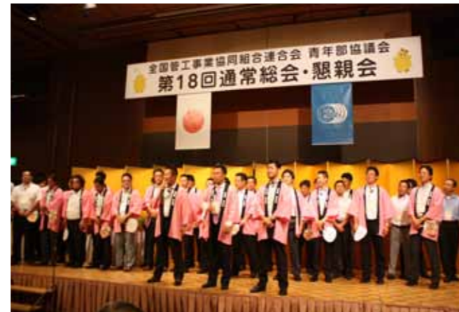
さいたま・川口・越谷松伏青年部

たりのトラブルに見舞われつつも迅速な対応と逆境をつかみのネタとして捉えるほどの柔軟な発想によって完璧ではありませんでしたが最高の歓待ができたのではないかと思います。今回の埼玉県での開催においてさいたま市、川口市、そして越谷松伏の3つの単組は総会の開催が決定になるまでほとんど交流がなく、総会開催に向け歩み寄り、そして打解けることができたことがもう一つの大きな収穫でした。手探りの状態から時間の制約等に追われ、打合わせもままならない中で新たな関係を築き上げていく勇気や、互いに信頼しあうことの大切さを学びまし