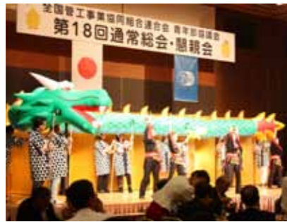
世界に誇る「さいたま竜神祭り」

最後にお忙しい中ご臨席賜りましたご来賓の皆様、全国青年部会員の皆様、賛助会員の皆様、この総会にお力添え下さいました全ての皆様のご健勝、ご多幸をご祈念申し上げ、埼玉総会のご報告とさせていただきます。本当に有難うございました。