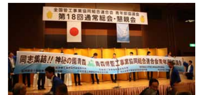
次年度は青森県で開催