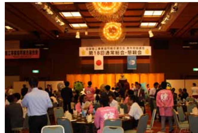
懇親会は埼玉のゆるきゃらも登場して賑わいを見せた