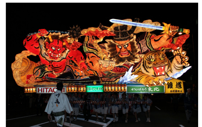
総会翌日の8月2日(日)からねぶた祭りが開催されます