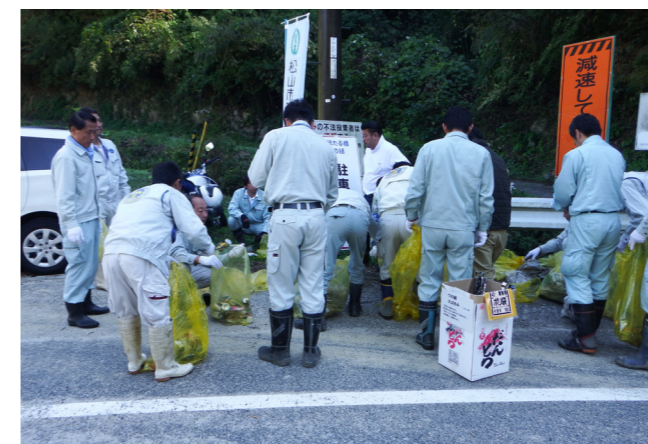
ゴミはこれだけ集まります