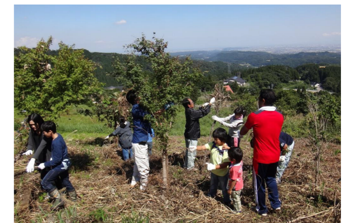
記念植樹の維持活動