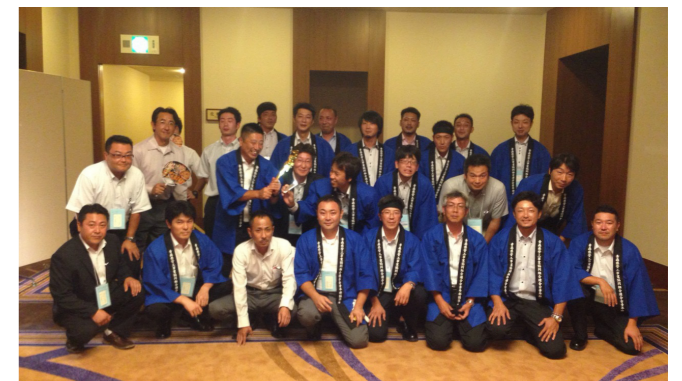
青森で待ってます!!

しかし、歴史的背景では『犬猿の仲』だった津軽と南部のふたつの地方が統合されてきた青森県。統一され