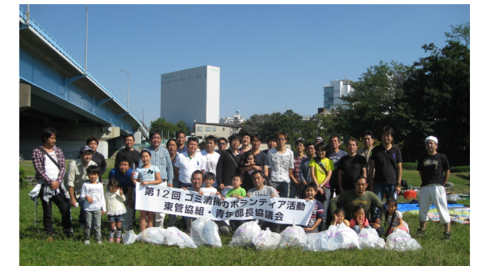
ゴミ清掃ボランティア活動

東日本大震災から約4年が経ち、あの時本当に水の大切さを実感しました。私自身も発電機をまわし、井戸水を汲み上げ、非常用水をポリタンクに何個も何個もためた記憶が今でも蘇ります。私達は水がないと生きていけないのです。そういった意味でも、自然の産物である水に感謝し、きれいでおいしい水を後世に残す為にもまずは自分の身近な所から始めることができるゴミ拾いは環