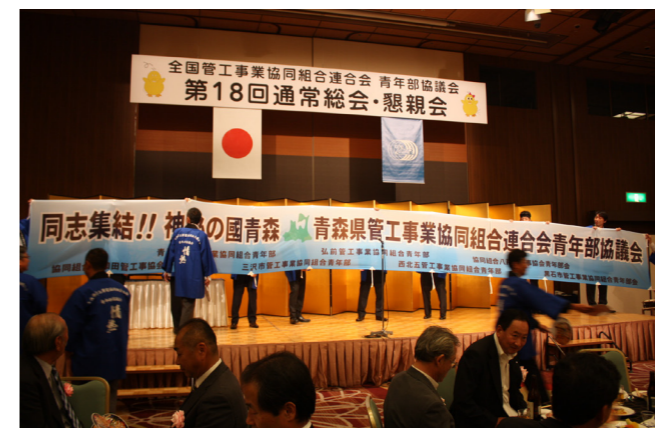
埼玉総会における青森総会のPR