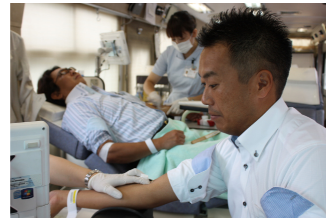
今年も献血事業を実施

総会本番までを振り返ると、地元スタッフも初めての事業ということで様々な課題にぶつかっていましたが、多く