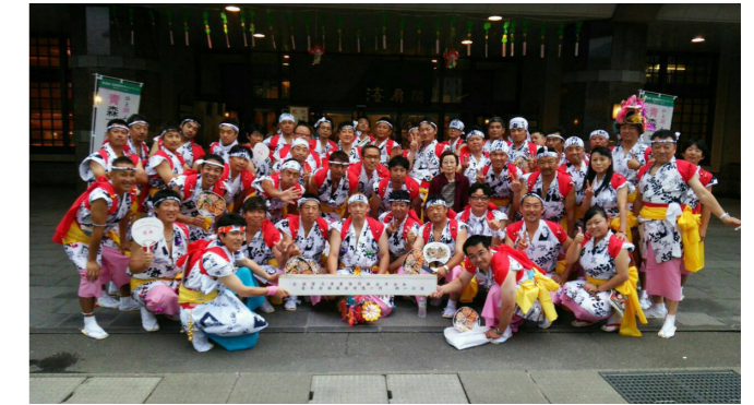
ねぶた祭り参加者

の皆様からのお力添えをいただくことで、大きな事故もなく無事に総会を終えることができました。また、皆が成功に向けて協力し合ってきたこの 1 年間の貴重な経験は、組織はもちろん個々においてもさらなる成長へ向けての糧となったのではと思います。