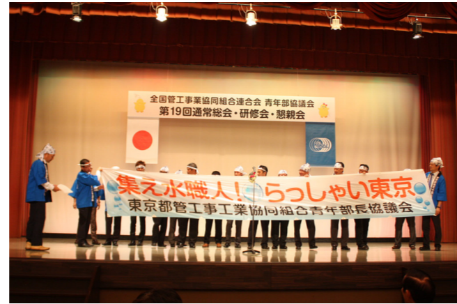
次年度は東京都で開催