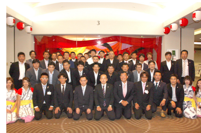
新しい役員で出発！