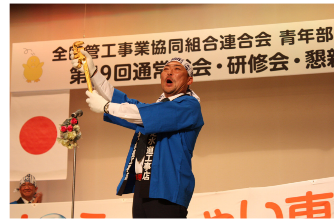
黄金のパイレンを掲げる村上東青協会長