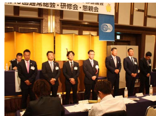
青森総会で秋山新体制がスタート