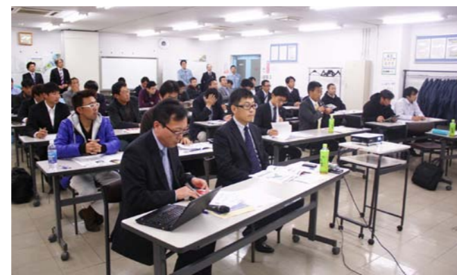
研修会を熱心に聞き入る参加者