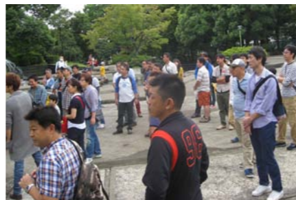
実施要領説明を受ける参加者