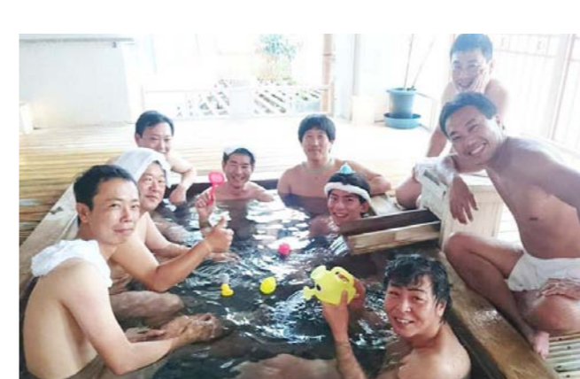
お約束の温泉写真