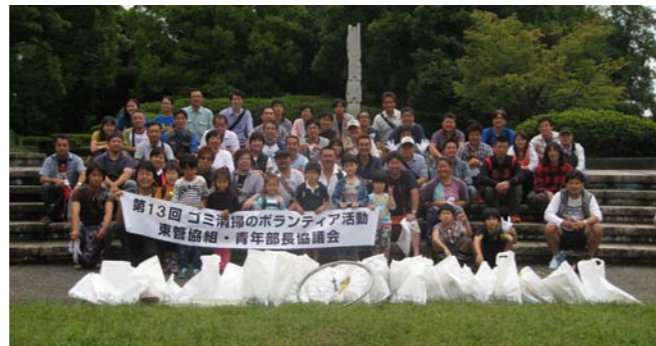
参加者一同で記念撮影