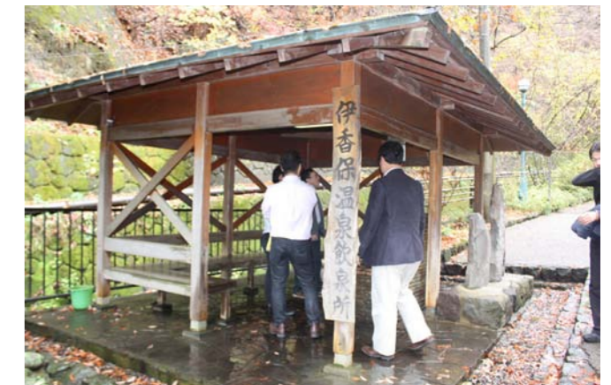
伊香保温泉めぐり