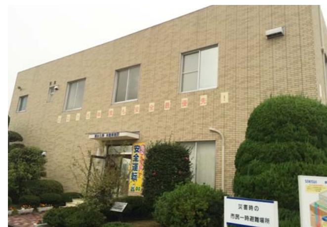
会場の積水化学工業(株)群馬工場