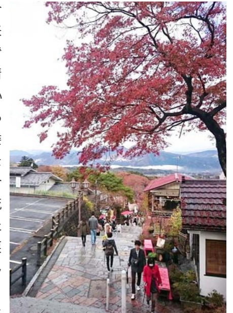
紅葉の伊香保温泉街