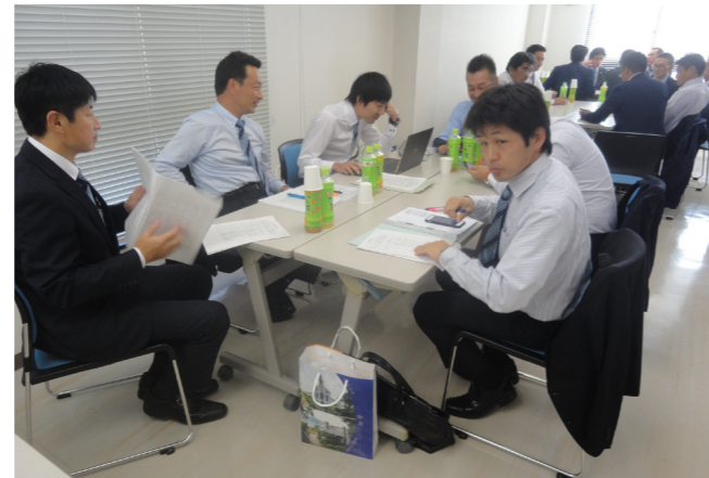
理事会後の総務・事業部会会議