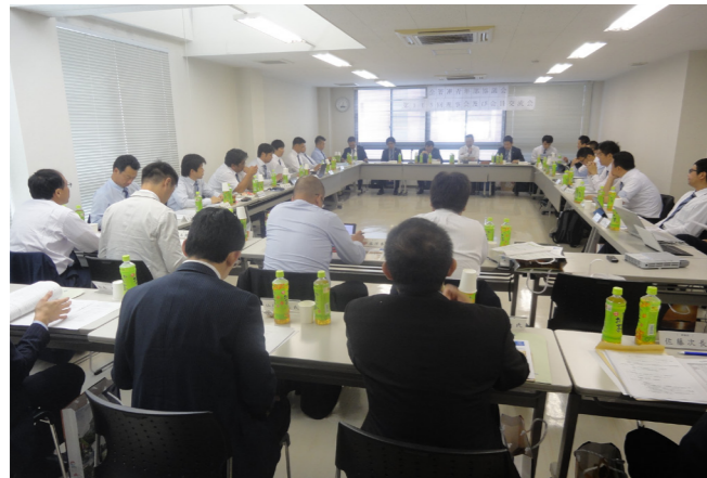
理事会で議事審議

最初に、当青年部から長崎市の伝統行事・観光名所・ 2つの世界遺産（明治日本の産業革命遺産・長崎と天 草地方の潜伏キリシタン関連遺産）を紹介し、その後、 当青年部の活動報告や長崎市管工業協同組合が取組む 穿孔事業、道路復旧工事、水道メーター検取替業務、 水道メーター取付・取替等業務、水道メーター器改造 修理、水道料金等収納業務、水道メーター検針業務を 説明し、事業運営が順調である事をアピールさせていた