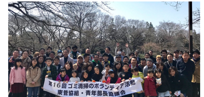
東京都管工事業協同組合青年部長協議会