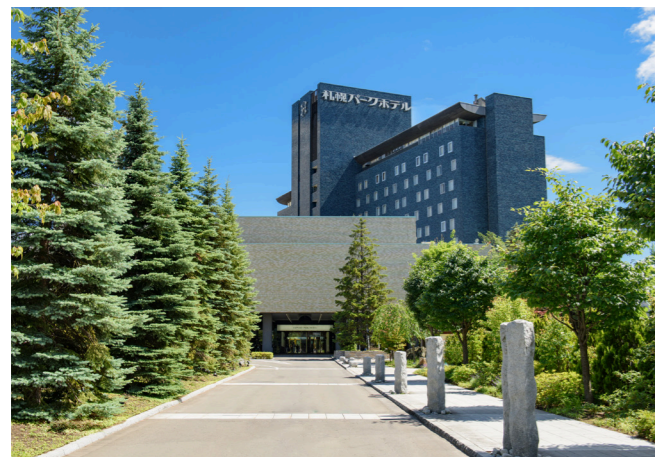
会場の札幌パークホテル