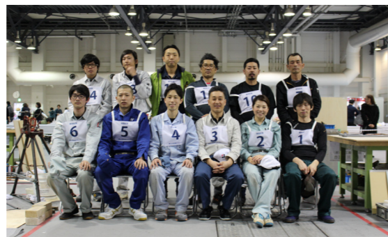
河野総務副部会長 (東京)