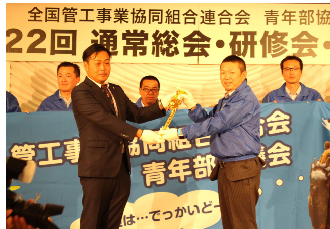
第22回通常総会開催地(福島)から黄金のパイレンの引継ぎ