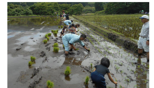
熊本市管工事協同組合青年部