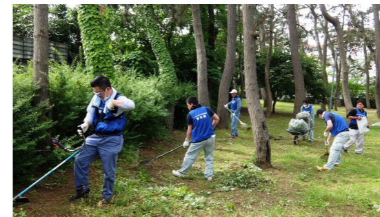
新潟市管工事業協同組合青年部