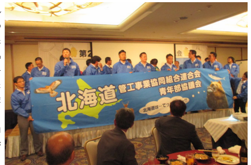
昨年の福島総会で北海道をPR