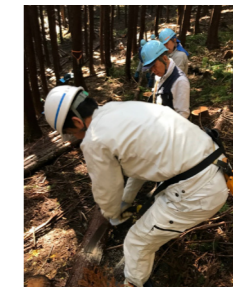
横浜市管工事協同組合青年部