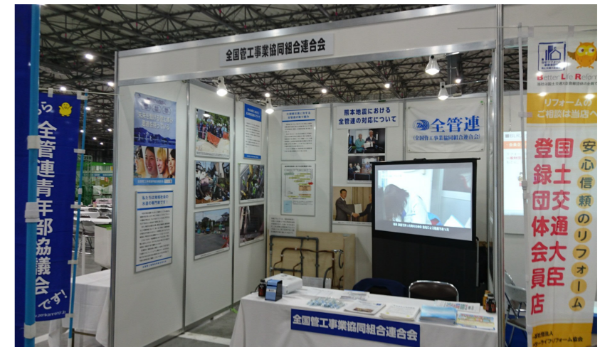
東京都管工事工業協同組合青年部長協議会

今回のブースでは青年部で作成した管工事の仕事紹介動画・リクルート編～未来を繋げる管工事が君達を待っ