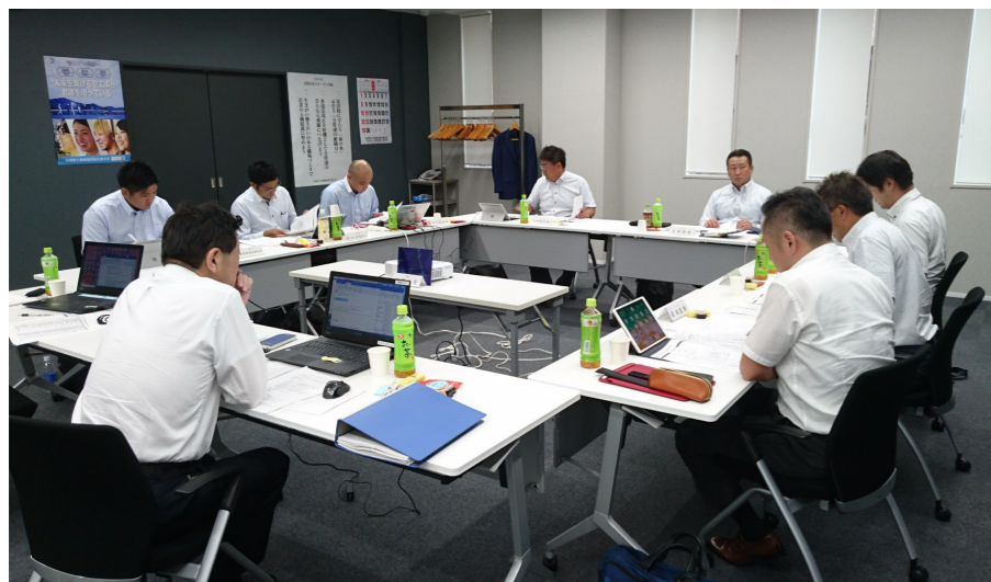
正副会長部会長会議

今後、青年部間の連携を深めながら、会員に有意義な事業を進行して行きたいと思えます。