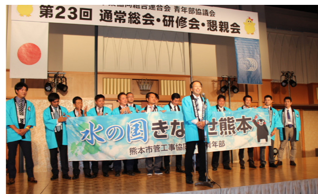
次年度開催地の熊本市青年部