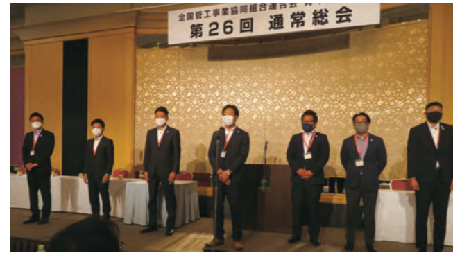
開催地挨拶をする宇都宮市青年部会