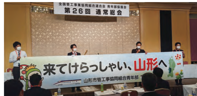
PRをする山形市青年部