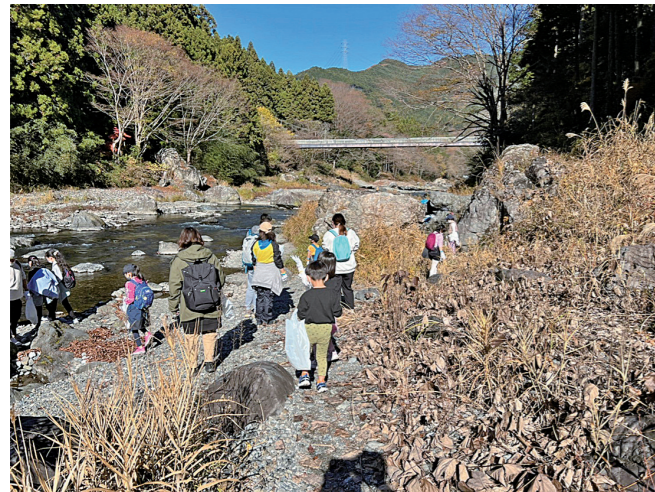
東京都管工事工業協同組合青年部長協議会

今後もこの事業をさらに魅力あるものにし、業界底上げの一助となるよう、引き続きのご協力を宜しくお願いいたします。