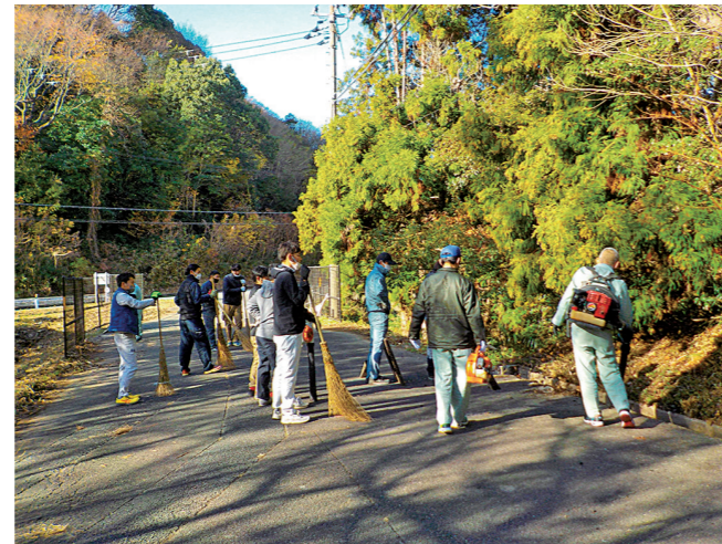
姫路市管工事業協同組合青年部