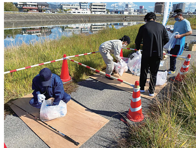
高知市管工事設備業協同組合青年部委員会