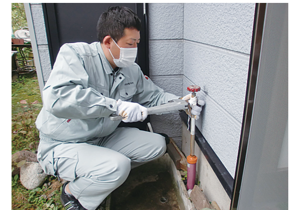
秋田管工事協同組合青年部協議会

この活動を通して、「水」に対して興味を持った子供たちが、将来業界を支える人材へと成長していくことになれば、まさに「担い手事業」の一面を持つ事業ともいえます。