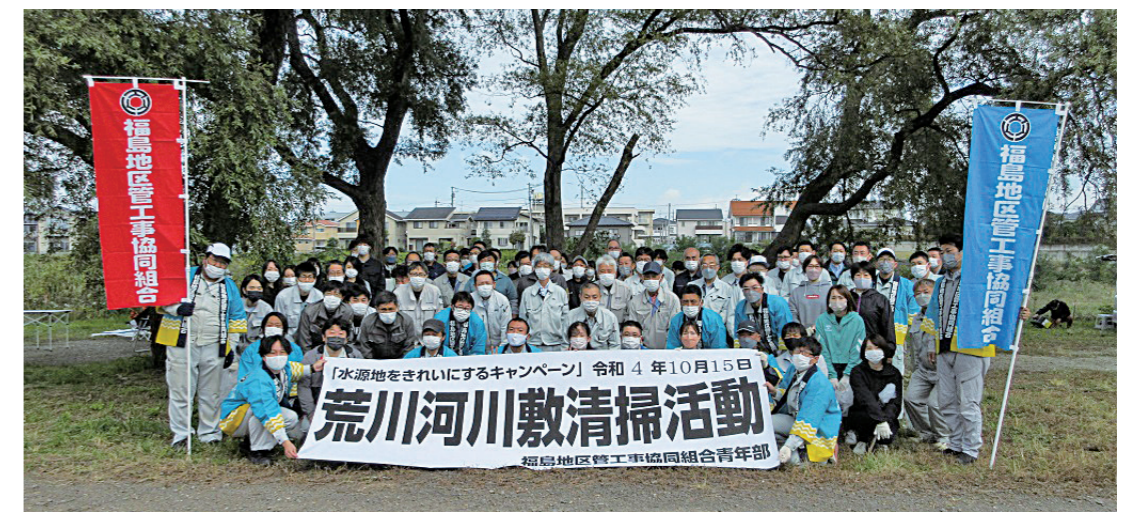
福島地区管工事協同組合青年部