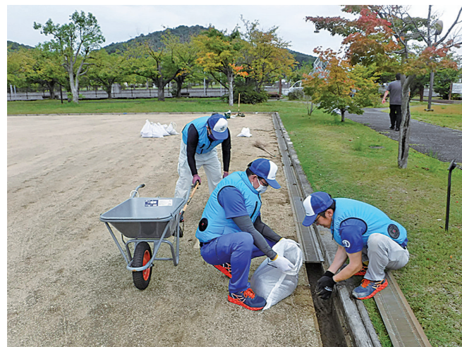
松山市管工事業協同組合青年部