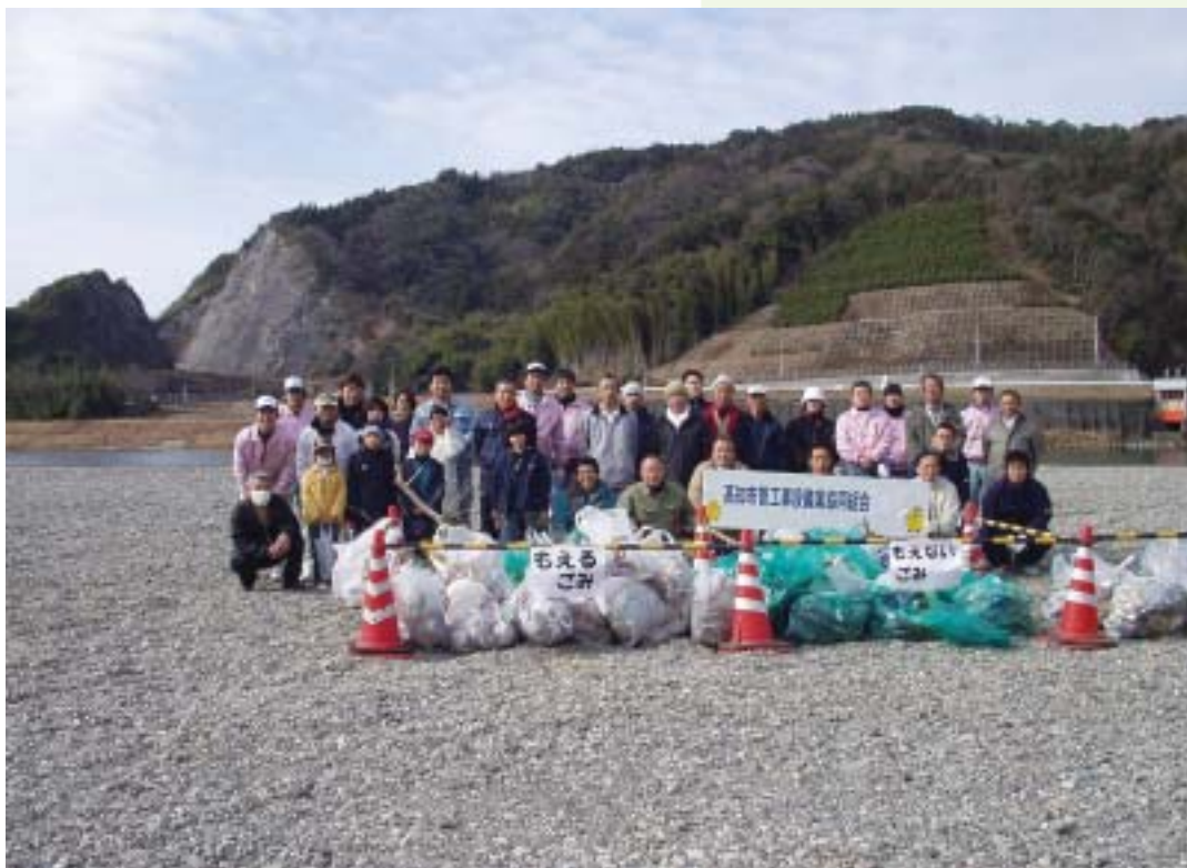
清掃終了後、集めたゴミを前に撮影